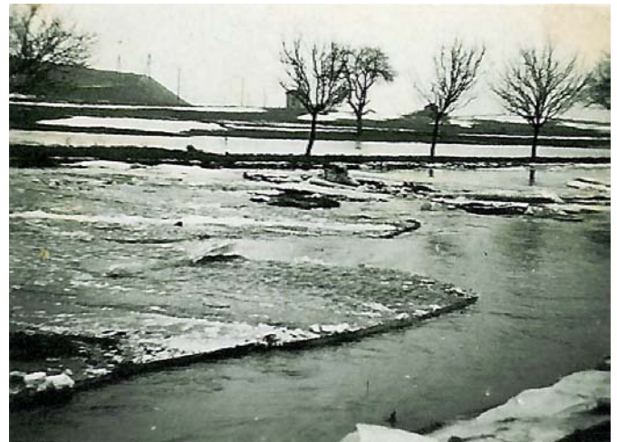
Überschwemmung der Serpina