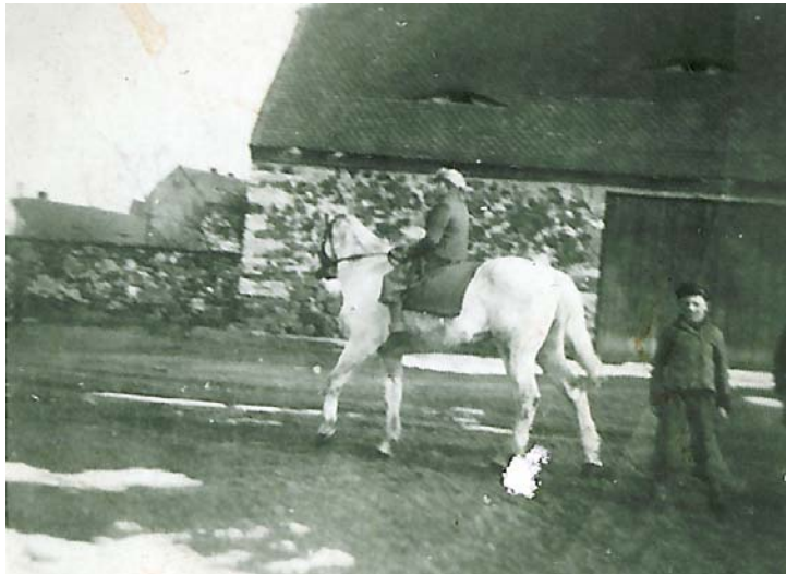
Schimmel, im Hintergrund die Scheune